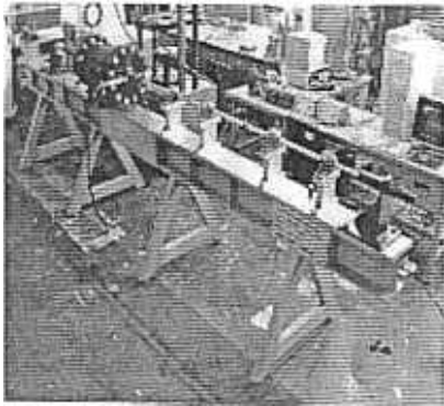
Fig. 1 Tension Split Hopkinson bar apparatus.