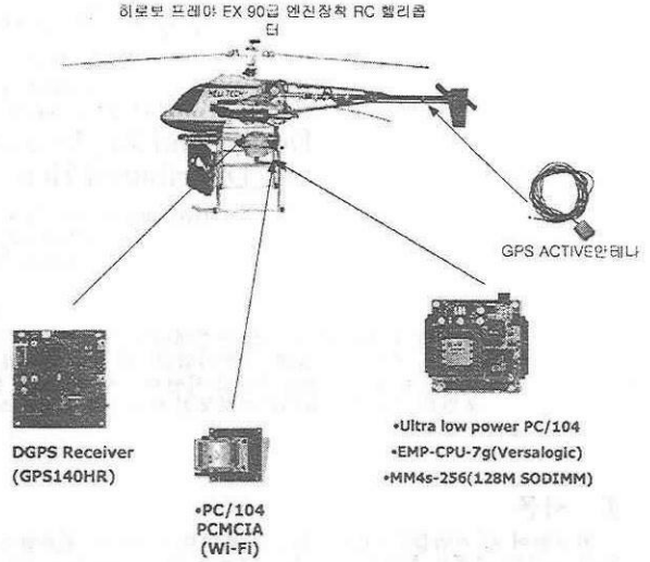
<그림 4> UAV 컴퓨터 시스템 및 컴포넌트