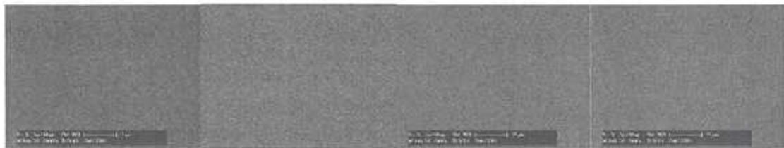
Figure 3. SEM images of laser cleaned zoned with thermophoresis condition

Figure 2에는 열영동 효과가 존재하지 않을 경우 기관으로 재부착된 데브리스트들을 보여주고 있다. 하지만 기관과 하부 챔버면 사이에 13K/cm의 온도차가 존재하는 Fig. 3의 경우에는 거의 데브리스트들이 부착되지 않는 특성을 보여주고 있다. 이러한 부착방지 특성은 온도이외에 다른 변수들에 의해서도 영향을 받는 것이 확인되었다. 발생한 데브리스트들이 챔버 내에서 일정시간 체류한 후 출구노즐을 통해 배출되는 형태이기 때문에, 출구노즐 주변 영역에 오염이 누적되는 현상이 관찰되었으며, 또한 레이저 스캔 방향과 기체 유동방향이 반대인 경우 즉, 데브리스트를 포함하고 있는 유동이 지세정된 영역 위를 지나가게 될 경우 마찬가지로 재부착이 증가하는 현상이 관찰되었다.