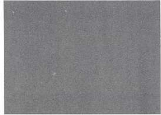
Figure 2. SEM image for re-deposited debris